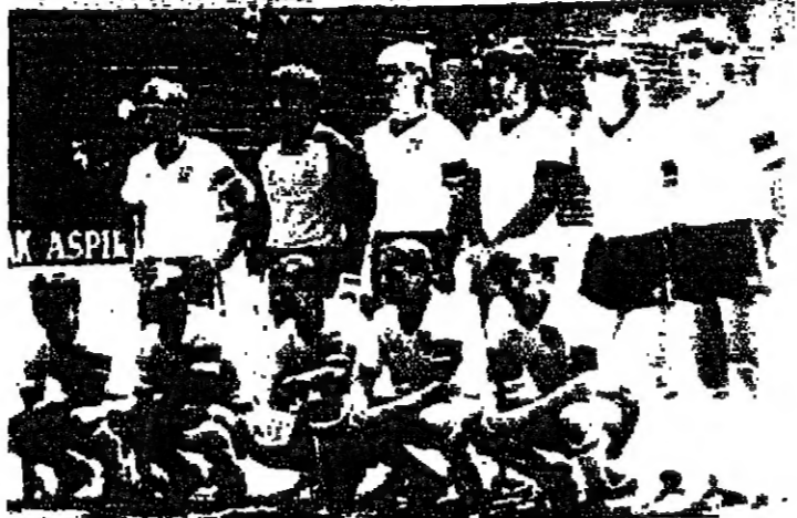
المنتخب الإنجليزي لهاتيت كاس العالم ويضم تريور فرايسس، بيتر سيلتون، ملك رايت، ملك هاتلي، كريس وايل، تيري بوتشر، كين سلوسوم، راي ويلكينز، بريان روبسون، تريور ستين وستينغز

تجر الاشارة الى ان العراق حل في المجموعة الثالثة مع بلجيكا والمكسيك وباراغواي وهي دول لا تفوق العراق من حيث المستوى والقوة.